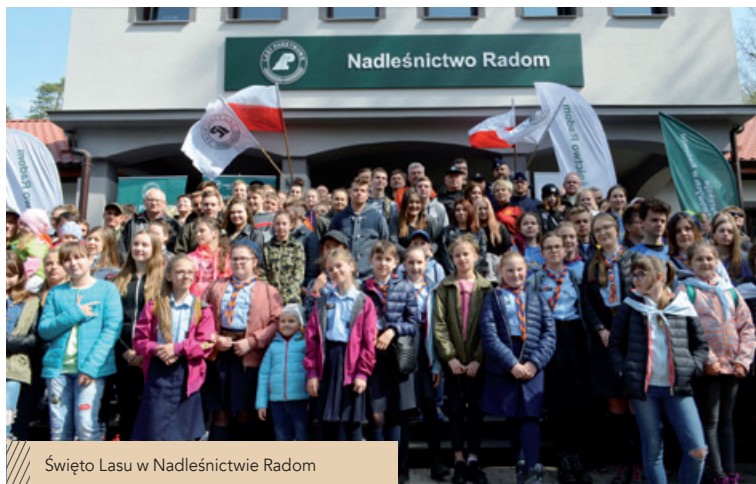
Święto Lasu w Nadleśnictwie Radom