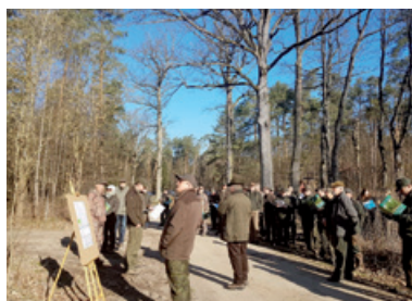
Wiedzy o dębach nigdy za wiele

rola w pielęgnowaniu dębów, nie trzeba nikogo przekonywać. Dlatego warto zadbać o odpowiedni udział lipy i grabu już na etapie zakładania upraw. Odwdzięczą się nam za kilkadziesiąt lat, gdy w drzewostanie będzie trzeba wykonać silniejsze cięcia w ramach trzebieży późnej. Solidny pułap drugiego piętra, sięgający podstaw koron drzewostanu głównego, zapewni odpowiedni mikroklimat, a także zacieni cenną część dębowych pni, chroniąc je od tzw. pędów epikormicznych (zwanych popularnie wilkami). Jak zauważył sam wykładowca, niektóre sprawdzone i popularyzowane przez niego metody trudno zmieścić w kanonie obowiązujących Zasad Hodowli Lasu. Wiadomo jednak, że ZHL mają charakter ramowy i kierunkowy, nie można ich traktować jak instrukcji lub sztywnego przepisu na sukces. Nowoczesny leśnik musi dopuszczać niestandardowe rozwiązania, które pozwolą mu skutecznie reagować na zmienne warunki otoczenia i zapewnią realizację celów hodowlanych.