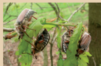
Żer regeneracyjny chrabąszczy

W związku z masowym pojawem chrabąszczy majowego ( Melolontha melolontha L.) i chrabąszczy kasztanowca ( Melolontha hippocastani F.) oraz znacznymi szkodami i wyczerpaniem innych metod ograniczania liczebności w drzewostanach nadleśnictw: Chmielnik, Staszów, Radom, Pińczów, Zwoleń, Daleszyce, Marcule, Ostrowiec Świętokrzyski oraz Starachowice i na terenie przyległych lasów niepaństwowych, w maju odbyło się ograniczanie liczebności chrabąszczy poprzez wykonanie agrolotniczych i naziemnych oprysków. Łącznie zabieg wykonano na 45 238 ha, w tym zabieg agrolotniczy na pow. 44 604 ha, a na pozostałej powierzchni zabieg naziemny. Mimo niesprzyjającej pogody, częstych opadów deszczu, wiatrów i dużej wilgotności powietrza zabiegi przeprowadzono, osiągając założone cele.