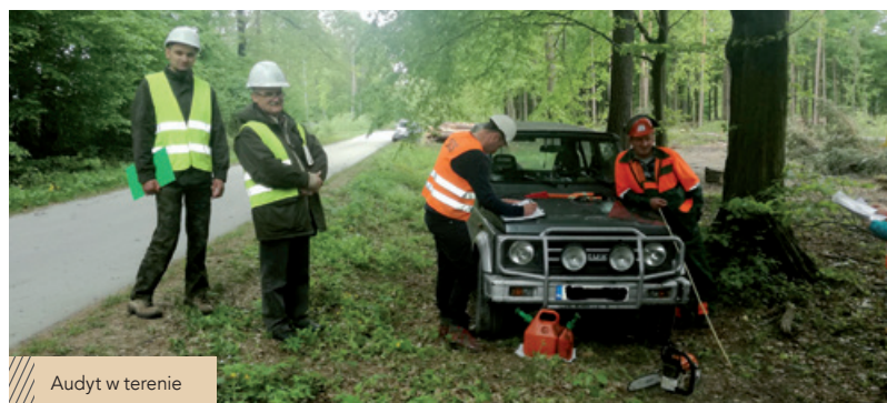
Audyt w terenie